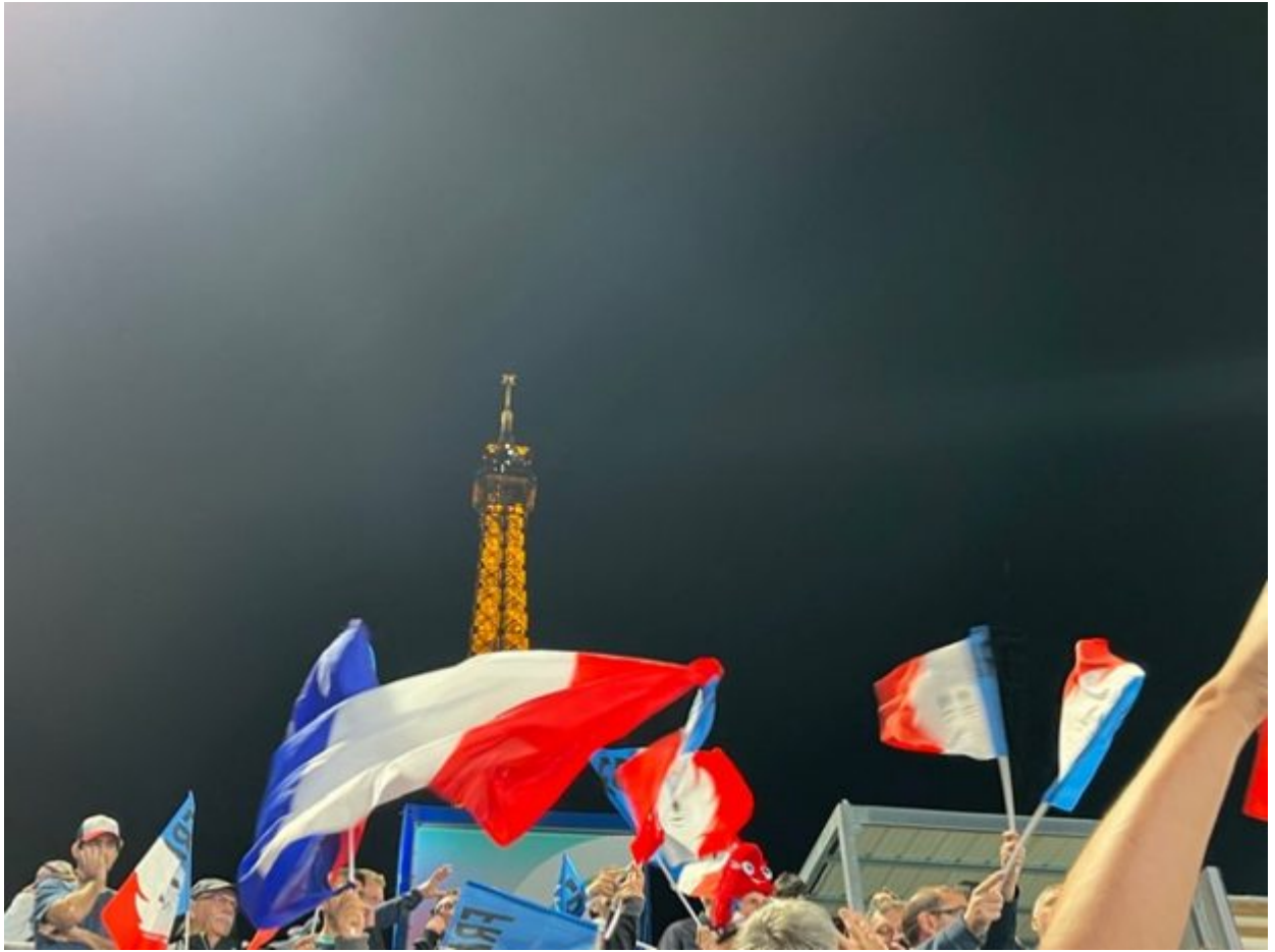
Stade de France : jour de para-athlétisme